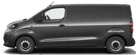
MERKUR-GRAU M01J 600,00 (714,00)