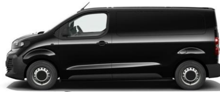
KARBON-SCHWARZ M09V 600,00 (714,00) nicht i.V.m. SPORTIVE