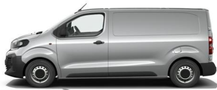
KONTRAST-GRAU M0F4 600,00 (714,00)