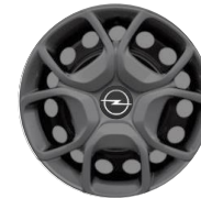
17-ZOLL-RADZIERBLENDE ZHYY Serie i.V.m. PDxx