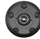
RADNABENABDECKUNG ZHYV, ZHYW, ZHZQ Serie