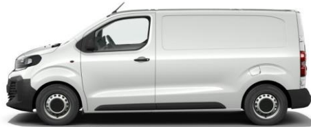
KAOLIN-WEISS POPR 0,00 (0,00)