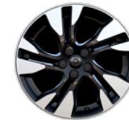
17-ZOLL-LEICHTMETALLFELGE ZHZN Serie i.V.m. SPORTIVE