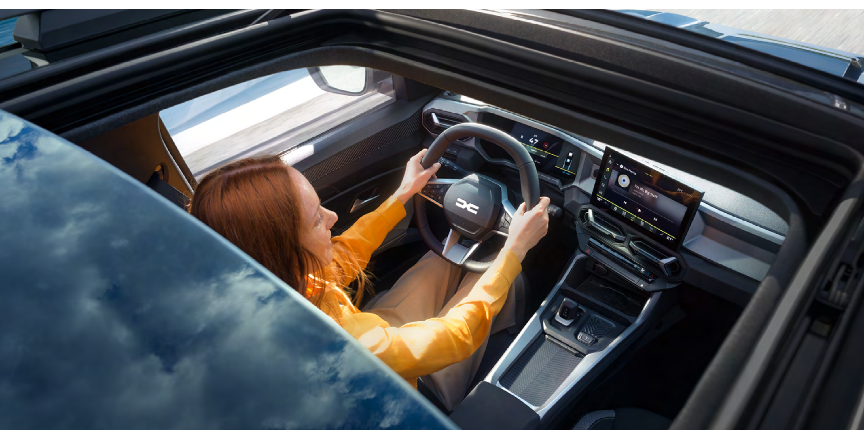
Elektrisch zu öffnendes Panorama-Glasschiebedach

Die Zweifarb-Lackierung verleiht dem Dacia Bigster eine ganz eigene Eleganz, mit der exklusiven Farbe Indigo-Blau wirkt er besonders edel. Das Panorama-Glasschiebedach bringt viel Licht und auf Wunsch auch frische Luft in den Innenraum.