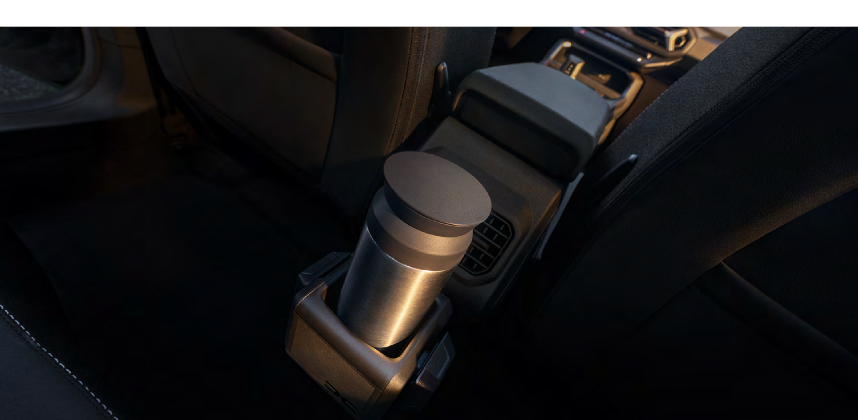
3-in-1 YouClip Element