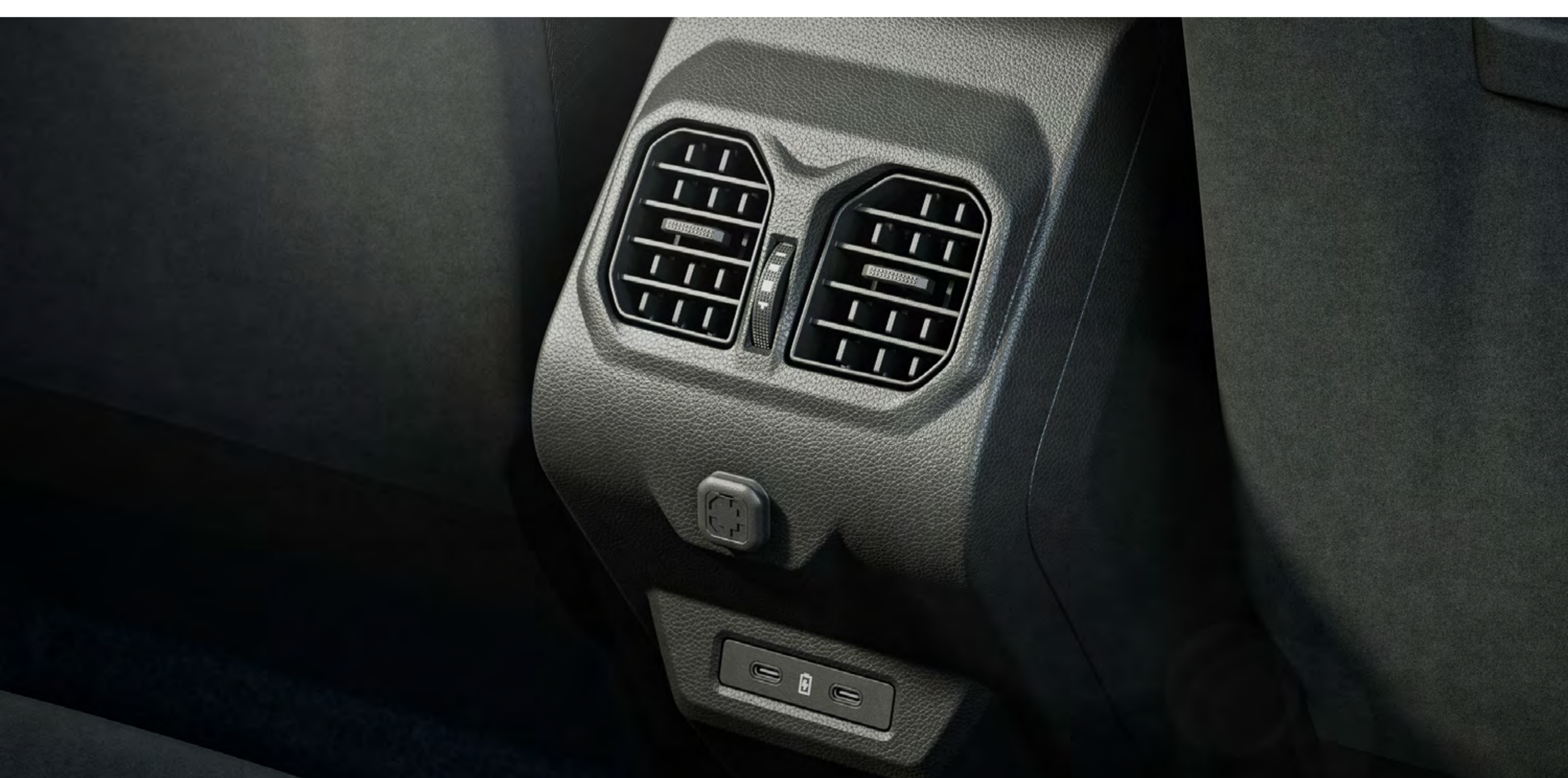
Lüftungsöffnungen im Fond

NÄHERE INFORMATIONEN ZU DEN HIER DARGESTELLTEN AUSSTATTUNGSMERKMALEN FINDEN SIE IN DER AKTUELLEN PREISLISTE.