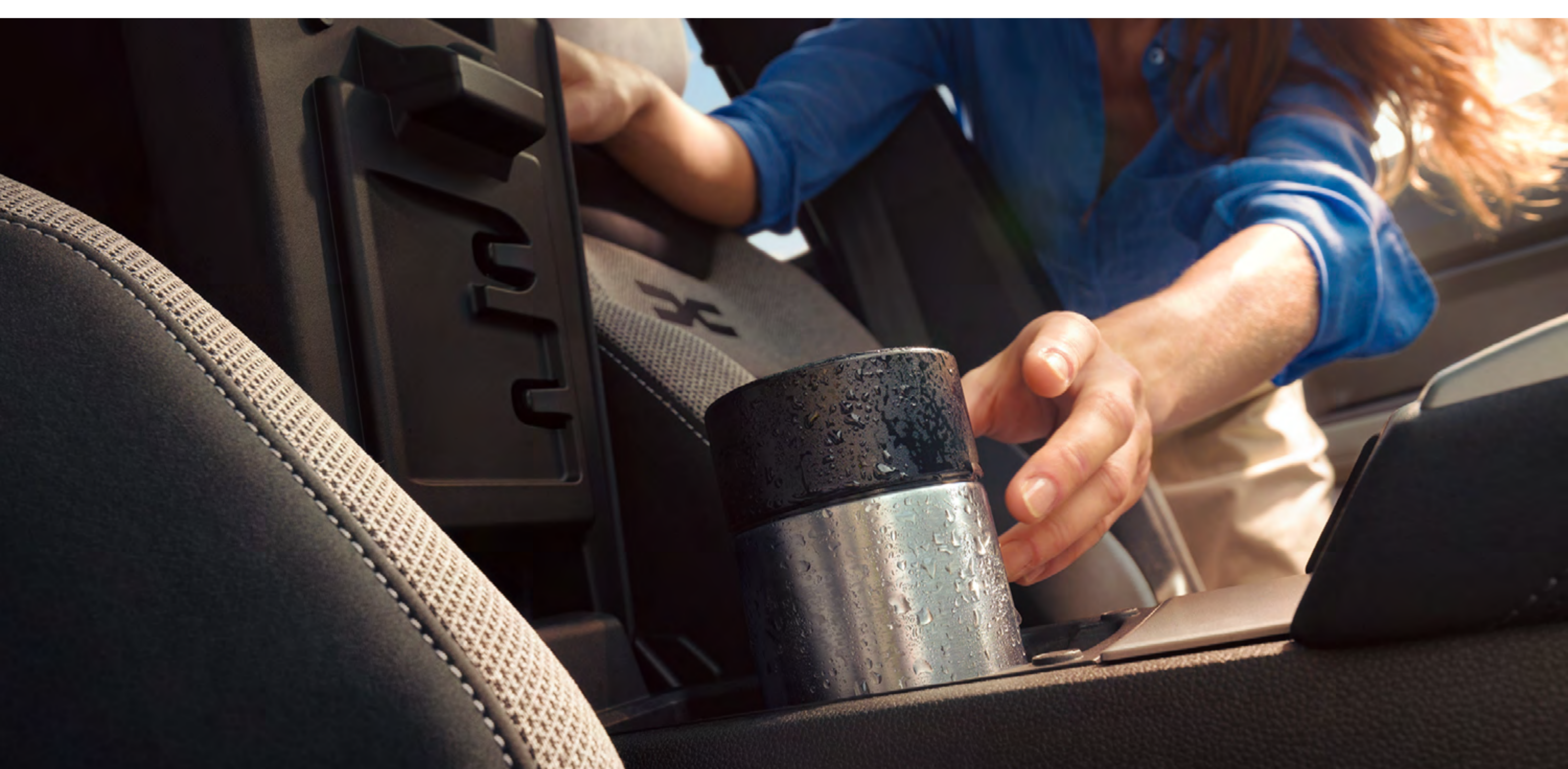
Gekühltes Staufach vorne

Entdecken Sie das clevere Befestigungssystem YouClip. Fünf im Fahrzeug verteilte Punkte – zwei weitere an den Kopfstützen sind optional – halten Telefon und Tablet, Getränke und andere wichtige Dinge immer sicher griffbereit.