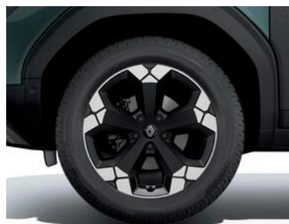
18-Zoll-Leichtmetallräder TAGASAN, glanzgedreht/ schwarz