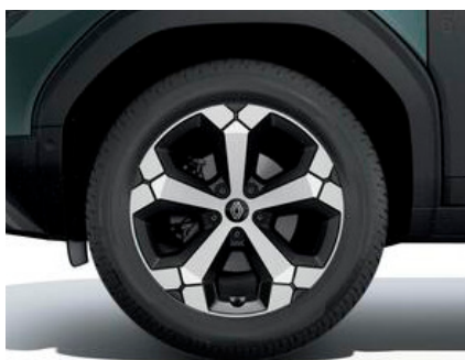
18-Zoll-Leichtmetallräder TAGASAN, glanzgedreht