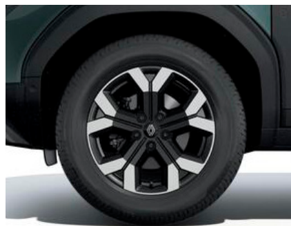
17-Zoll-Leichtmetallräder TERGAN, glanzgedreht/ schwarz